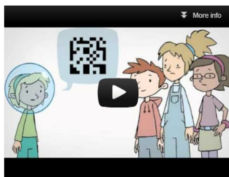
La escafandra de Clara.

Clara es una niña con un sueño: ir a la luna. Lo hará realidad gracias a la ayuda de sus amigos, especialmente de Pedro, un amigo muy especial. Juntos conseguirán viajar a la luna.