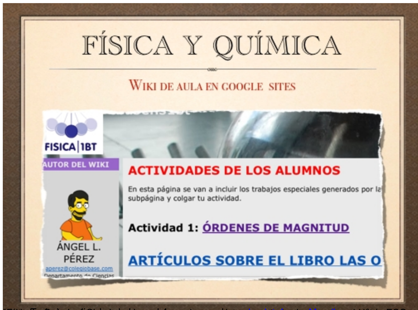
Figura 1. Ejemplo de la estructura de los trabajos basados en la actividad de los alumnos en la plataforma ESO