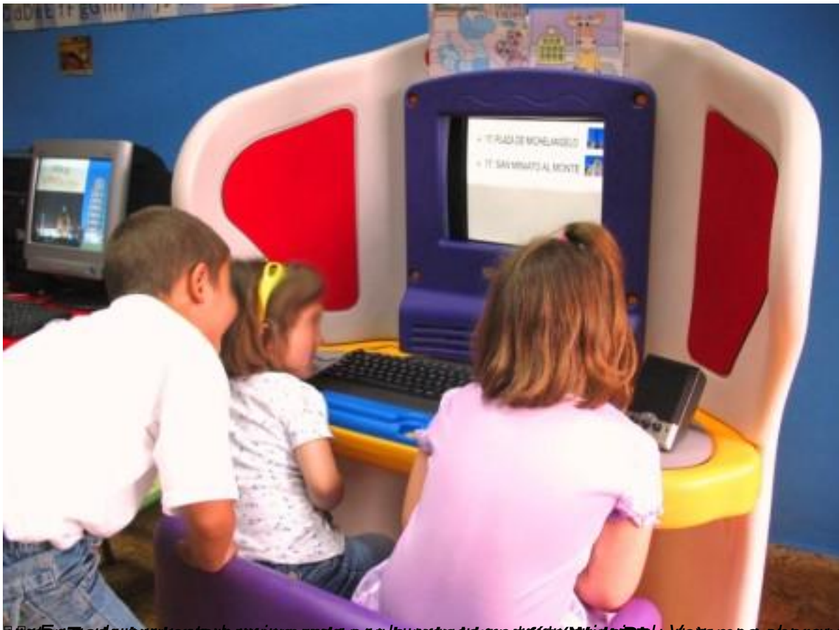
educación TIC en el 2º Ciclo de Educación Infantil: uso de herramientas web 2.0