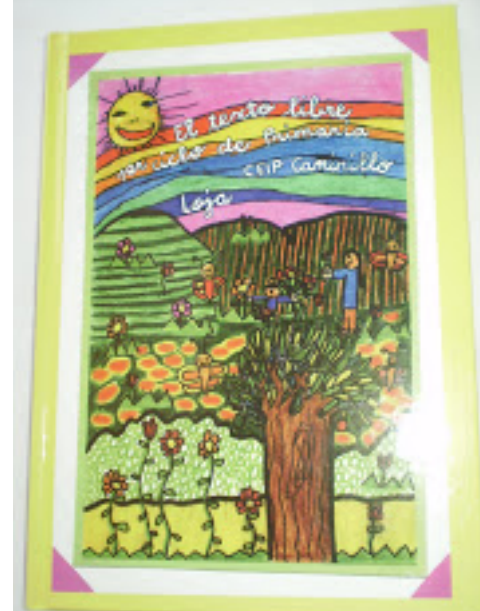
El texto libre. Fernando Savater.