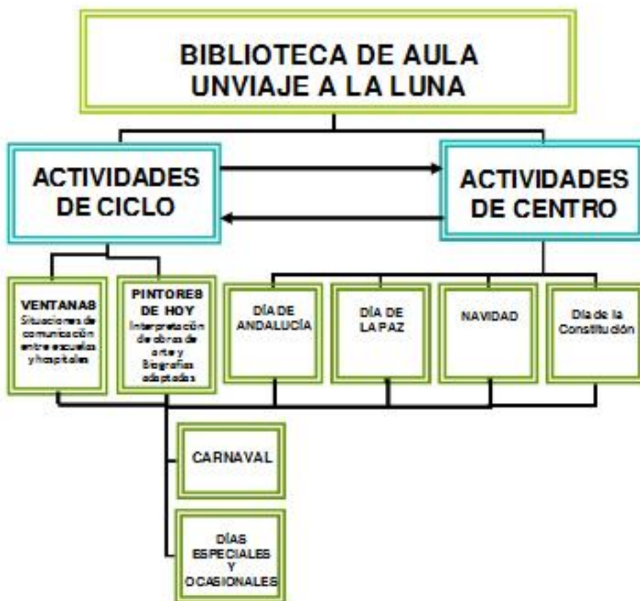
PANEL DEL RECORRIDO DEL VIAJE A LA LUNA