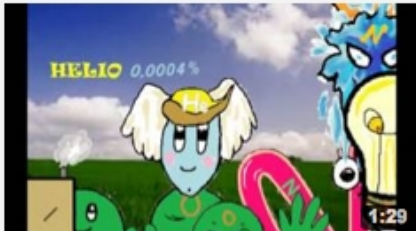
Y tu...¿que respiras?

títulos tan sugerentes como: La formulación amorosa, Química de las estrellas, Química con humor, Fórmula rapeando, Radio Física FM y muchos más que harán las delicias de tus alumnos cuando los proyectes en la pizarra digital.