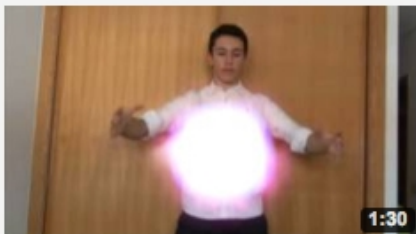
Mago VS Químico