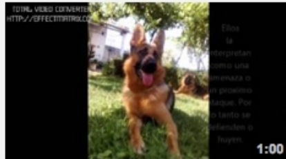
El olor del miedo