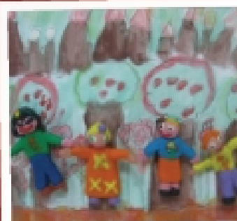
DE NUESTRAS VIDAS

LIBROS DIGITALES que se realizaron por integrantes de DIM. www.dimensional.com y www.dimensional.com pueden ser consultados en cualquier momento. OTROS CON AMOR Y COMPAÑERISMO las siguientes secciones ofrecen otro tanto de información y recursos. PROYECTOS: