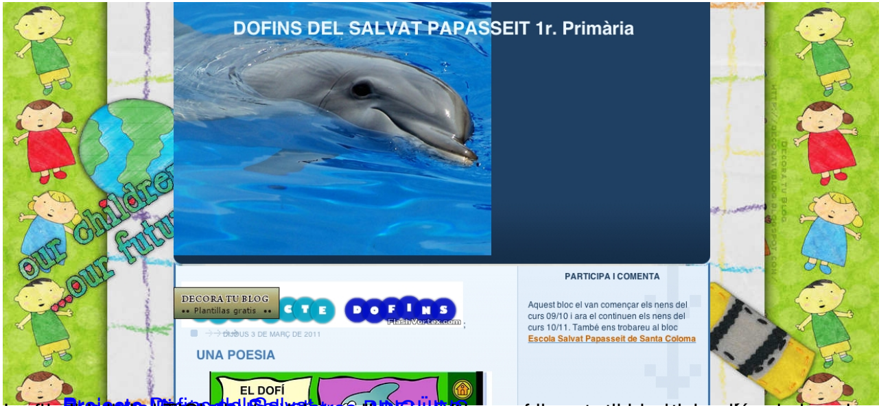
En el blog de la Escola del Salvat Papasseit s'utilitzen recursos de refrigerament i de participació de los alumnes